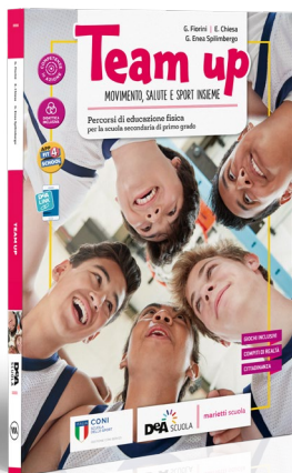
SCUOLA SECONDARIA DI I GRADO